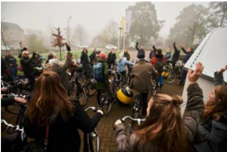
Vertrek vanaf het CKC & Partners voor een fietsexcursie.

De viering van Zoetermeer 60 jaar New Town werd extra luister bijgezet door het symposium Post 65 Erfgoed en Stadsontwikkeling op 29 november dat plaatsvond in het CKC & Partners aan de Leidsewallen. De gebouwen en wijken uit de periode Post 65 stonden centraal. Zij vormen ons jongste erfgoed, maar veel wordt de komende tijd getransformeerd, verduurzaamd of gesloopt. De stad en haar inwoners veranderen tenslotte voortdurend. Daarom is het urgent deze periode in kaart te brengen en de kernwaarden te bepalen. Het middagprogramma bestond uit lezingen, een panelgesprek en de presentatie van de resultaten van de inventarisatie Post 65 architectuur en stedenbouw. Voorafgaand aan het middagprogramma kon men onder leiding van gidsen deelnemen aan verschillende excursies door Zoetermeer.