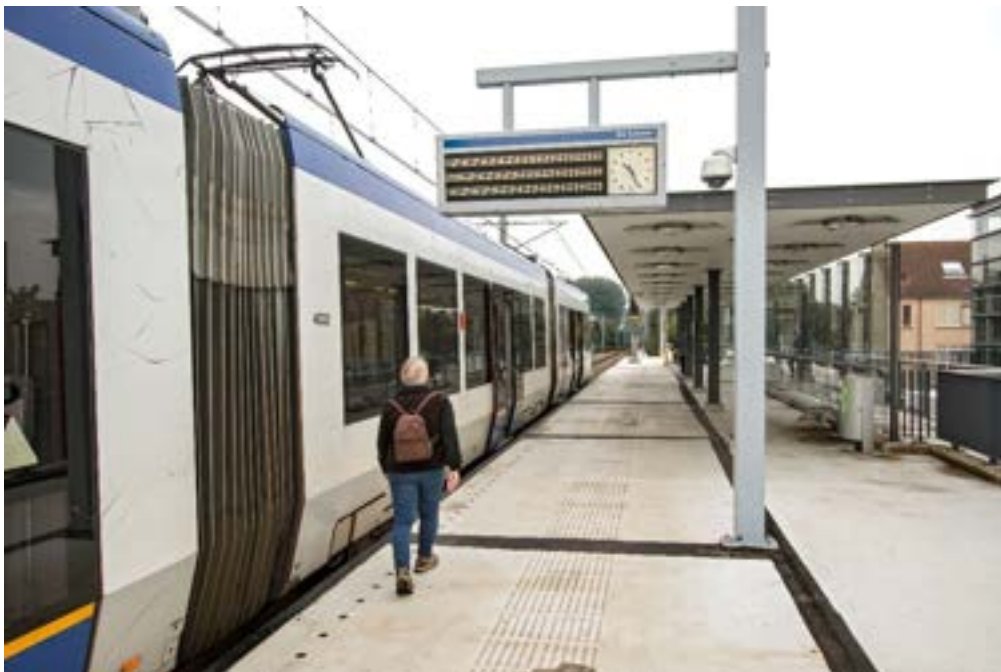
Station De Leyens (lezing Van Zoetermeerlijn tot hubs en deelfietsen).