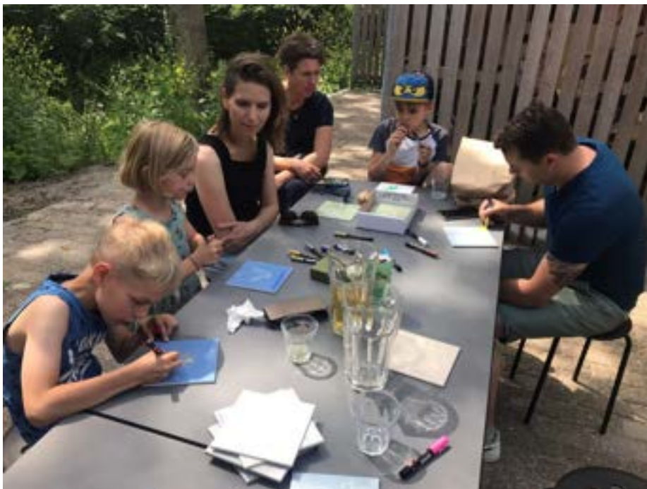
Kinderworkshop tegels beschilderen bij Kunstgarage Franx tijdens de Dag van de Architectuur.

Het thema van de Dag van de Architectuur, op zaterdag 18 juni, was (T)huis in New Town Zoetermeer; (T)huis in het groen, aan het water, in het dorp, in de nieuwe stad. Vragen als 'Voelt de Zoetermeerse architectuur als (T)huis voor jou? Wat is bijzonder aan de architectuur van Zoetermeer?' stonden daarbij centraal. De opening vond plaats in Club Entree aan de Boerhaavelaan, tegelijk met een tentoonstelling over architect Jan Sterenberg 'Constructie en context. Bouwen in serie. Fijne rijtjes, Jan!' Er waren acht gebouwen voor bezoek opengesteld, waar diverse activiteiten werden aangeboden zoals rondleidingen, tentoonstellingen, de stadsmaquette, de film 'Schrootjes, zitkuilen en punaises' en (kinder)workshops.