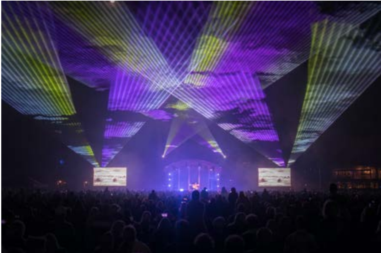
Spectaculaire lichtshow Sweetlake City 60 jaar New Town op 7 oktober.

Op 7 oktober vond op de Markt de goed bezochte en spectaculaire lichtshow plaats die in het teken stond van 60 jaar New Town. Een bijzondere manier om het grote publiek het jubileum te laten beleven en vieren. Het ArchitectuurPunt heeft met de organisator gesproken en geadviseerd over de inhoudelijke invulling met de opzet van de tijdlijn, de meest opvallende gebouwen en plekken, en de te gebruiken foto's.