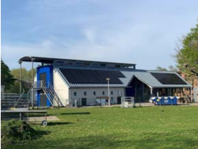
De Balijhoeve was één van de opengestelde gebouwen tijdens de Dag van de Architectuur.

De Dag van de Architectuur werd georganiseerd in samenwerking met Schatbewakers, Gemeente Zoetermeer en Netwerk Zoetermeer.