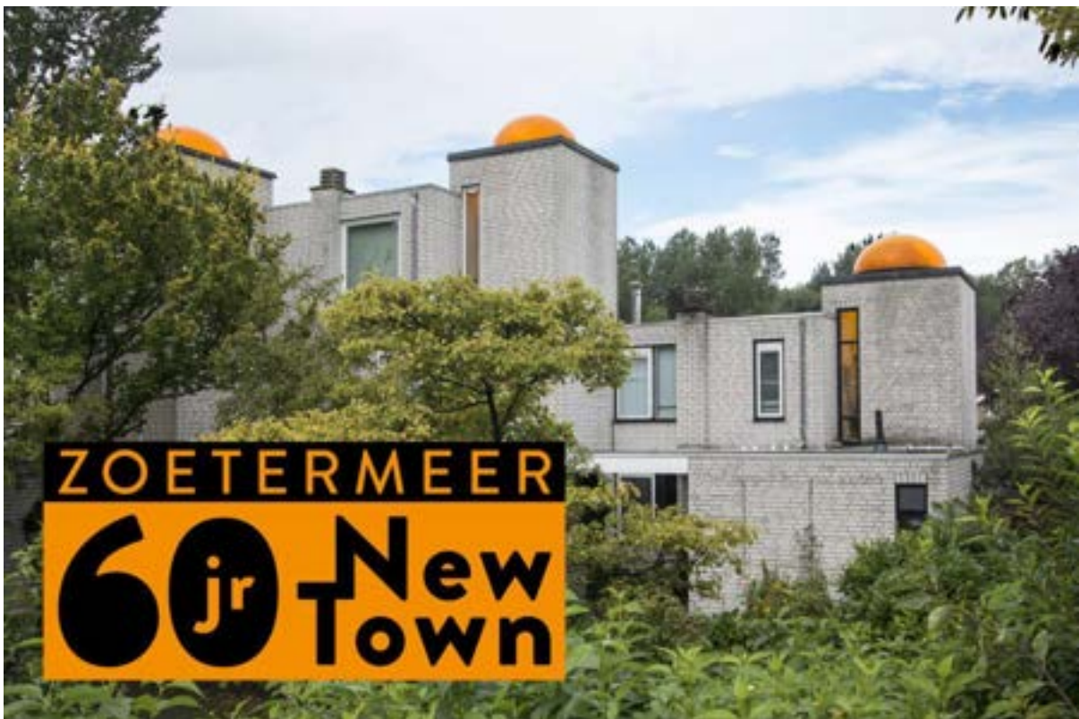
Koepeltjeswoningen, 60 jaar New Town.

In 1962 werd Zoetermeer aangewezen als groeikern en nam de geschiedenis een spectaculaire wending toen dat kleine dorpje uitgroeide tot een grote en volwaardige stad. Dat was 60 jaar geleden en dit feit is niet bepaald ongemerkt voorbijgegaan. Het ArchitectuurPunt heeft als één van de initiatiefnemers geparticipeerd in de organisatie en actief meegewerkt aan de verschillende festiviteiten. Dit jubileumjaar zorgde voor extra veel aandacht en belangstelling voor de architectuur en stedelijke ontwikkeling in Zoetermeer. De activiteiten zijn zeer goed bezocht en er was veel media aandacht.