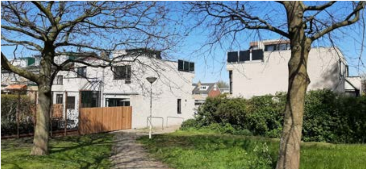
Woningen Van Boisotring, Palenstein, het gebouw van de maand april.