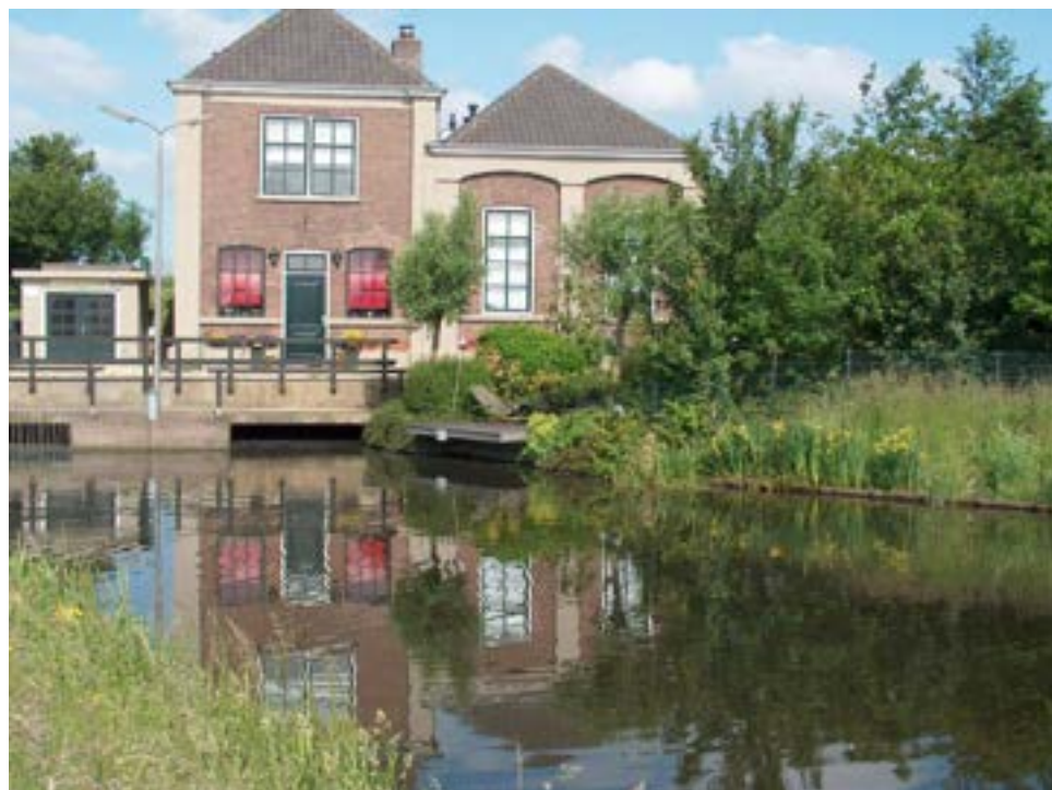
Gemaal De Nieuwe Polder uit de fietsroute 'Water in Zoetermeer'

In verband met coronabeperkingen kon men de route alleen op eigen gelegenheid fietsen. Men kon een gedrukt exemplaar van het boekje ophalen op 19 juni bij het Forum, bij boekhandel De Kler en het Historisch Genootschap Oud Soetermeer. Ook was de route online beschikbaar.