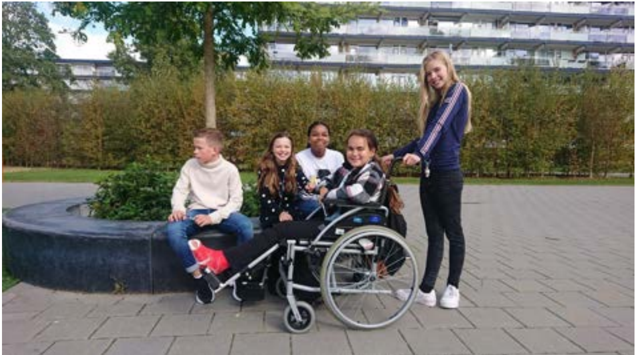
Architectuurwandeling Driemanspolder met leerlingen ONC Clauslaan

Ook dit jaar heeft het coronavirus een stempel gedrukt op de organisatie van activiteiten. Het begint te wennen, maar prettig was anders. Desondanks was er gelukkig toch weer veel mogelijk. Een greep uit de activiteiten: lezingen, architectuurwandelingen, de Dag van de Architectuur traditiegetrouw in juni en in november de première van de film over Post 65 in Zoetermeer.