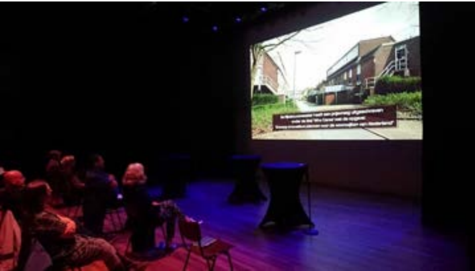
Vertoning van de documentaire 'Rijksbouwmeester – Architectuur en maatschappij'