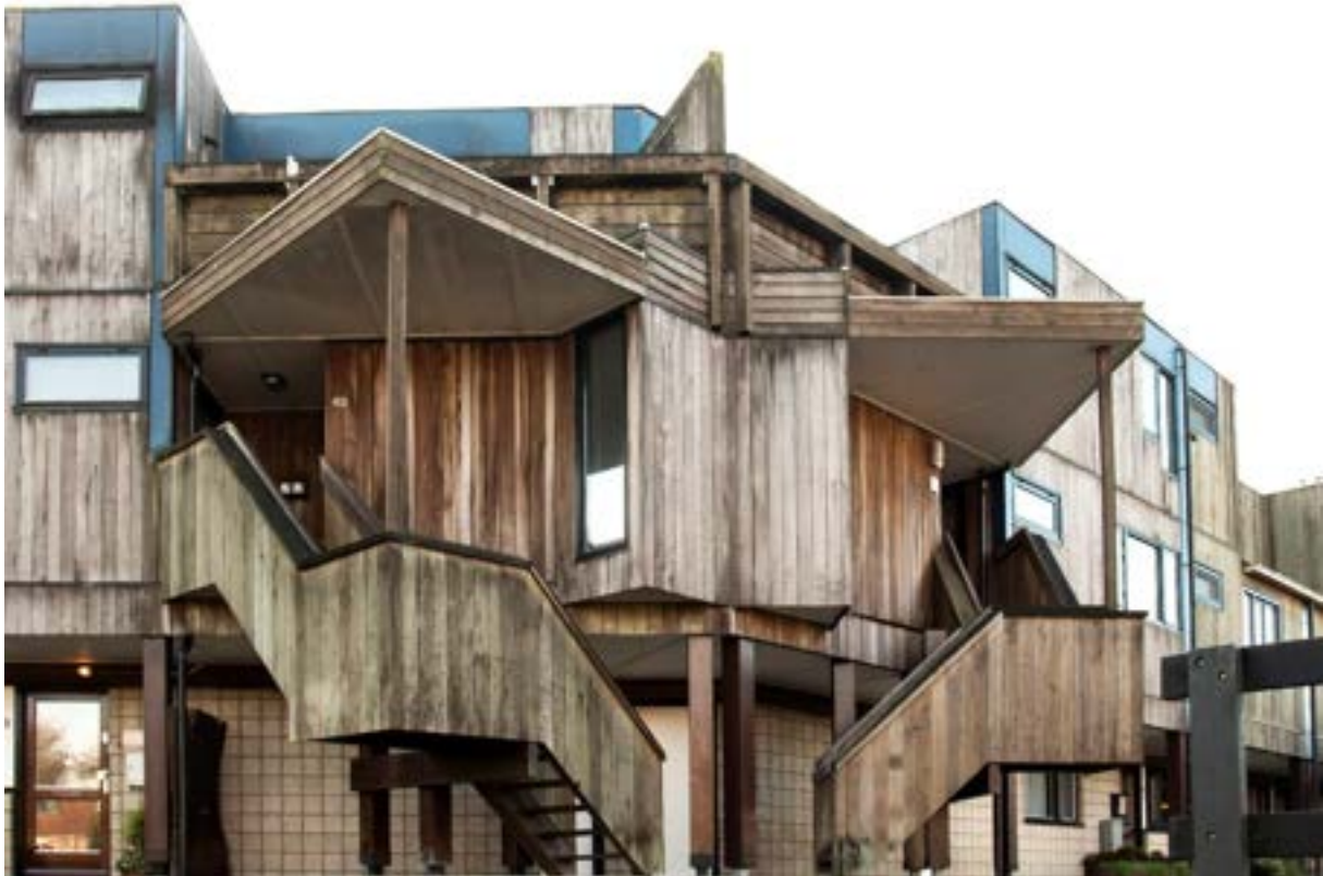
Gebouw van de maand december: 'Houtskeletbouw in Seghwaert'