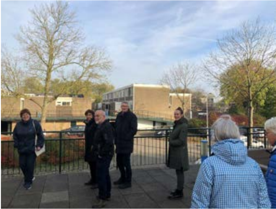
Architectuurwandeling Meerzicht-Laag met bezoek aan de woondekken