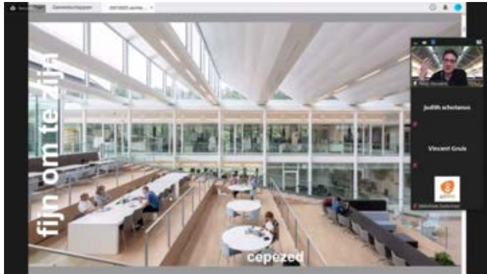
Stadslezing 'Circulair bouwen zonder afval'

Online stadslezing 'Circulair bouwen zonder afval'. Vincent Gruis (hoogleraar TU Delft) liet zien dat er steeds meer innovatieve manieren zijn om materialen en afval opnieuw te gebruiken. Paddy Sieuwerts (architect, cepezed) liet voorbeelden zien van gebouwen die als een 'bouwpakket' in elkaar gezet worden en bovendien demontabel zijn.