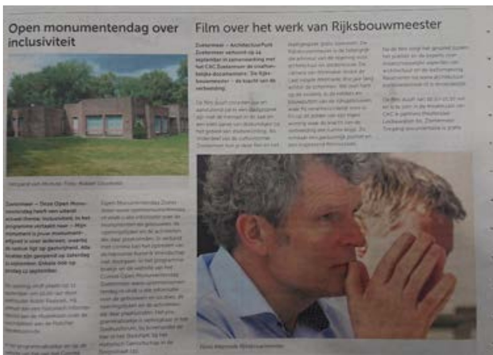
Artikel in het Streekblad over de documentaire 'Rijksbouwmeester – Architectuur en maatschappij'

Het ArchitectuurPunt Zoetermeer werkt samen met Gemeente Zoetermeer Schatbewakers Onze Zoetermeerse Bouwsociëteit (OZB) Historisch Genootschap Oud Soetermeer INTI (International New Town Institute) Het Forum Zoetermeer Terra Art Projects DuurSamen Zoetermeer Actief Hoofdbibliotheek Netwerk Zoetermeer Permanente Marktdialoog Zoetermeer (PMZ)