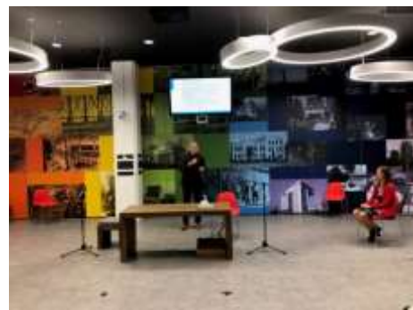
Online stadslezing 'Woonvormen voor senioren'