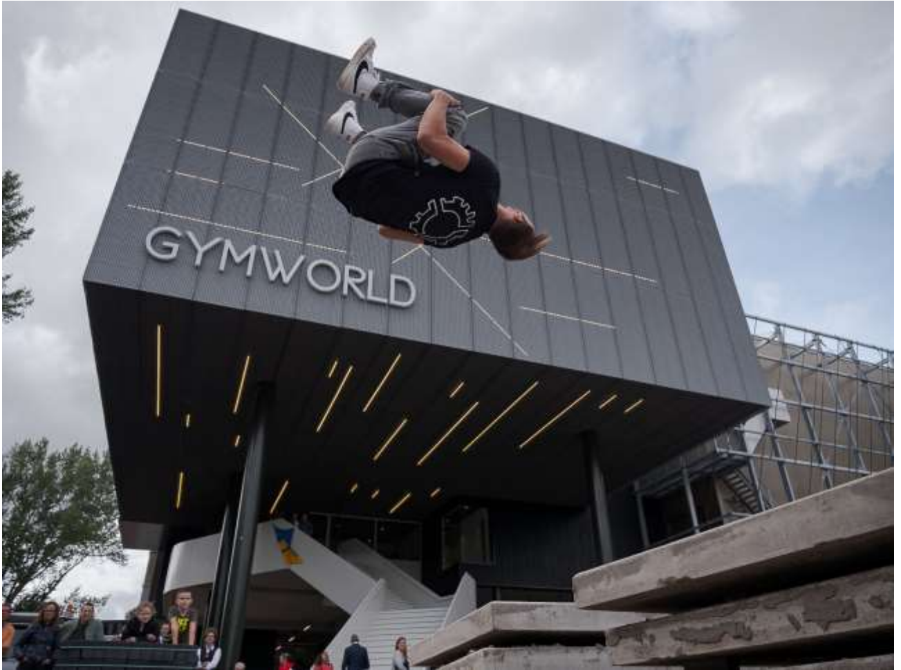
Dag van de Architectuur met Gymworld

Door corona was het niet mogelijk de Dag van de Architectuur op de landelijk geplande datum van 21 juni doorgang te laten vinden. In Zoetermeer is gekozen voor een combinatie met de Open Monumentendag op zaterdag 12 september. Het thema was 'Architectuur, een publieke zaak', maar daar is door de beperkingen niet sterk op ingezet en is er geen lezing georganiseerd.