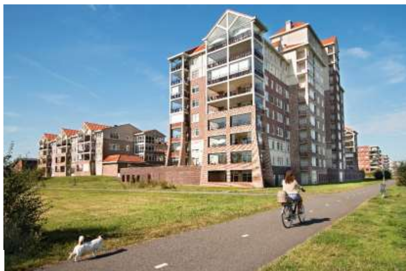
Nova Campagna, het gebouw van de maand juni

mei: wijkkerk De Doortocht, Hekbootkade 60 door Karen Kranen