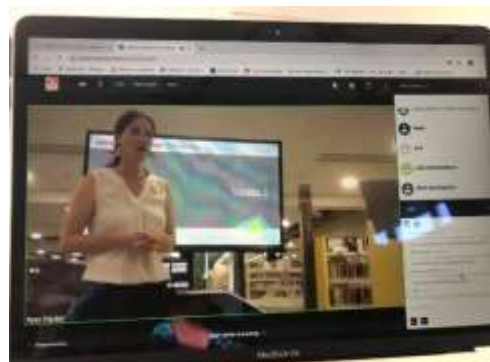
Online stadslezing 'Hout architectuur'

Het jaar 2020 was nog geen drie maanden oud, of het coronavirus had alles op zijn kop gezet. Vele geplande activiteiten konden of geen doorgang vinden of moesten worden aangepast. Ondanks de beperkingen is er gelukkig toch veel mogelijk gebleken. Een succes waren bijvoorbeeld de lezingen, die dankzij de medewerking van de hoofdbibliotheek online konden worden georganiseerd en die – onverwacht – meer bezoekers bleken te trekken dan de traditionele lezingen. De twee online lezingen werden door ongeveer 80 mensen bijgewoond, de traditionele lezingen trekken rond de 40 bezoekers. Dankzij de chatfunctie kon iedereen voldoende bij de lezing worden betrokken. Ook de Dag van de Architectuur, gecombineerd met de Open Monumentendag, kon alsnog in september doorgang vinden en was zeer geslaagd.