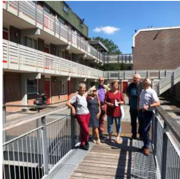
Architectuur Ommetje over de woondekken in Buytenwegh

Tevens werden door Stichting Floravontuur Promotie Zoetermeer in samenwerking met het ArchitectuurPunt vier nieuwe wandelingen door de wijken Buytenwegh, De Leyens, Seghwaert en Noordhove uitgebracht, geschreven door Simone Langeveld.