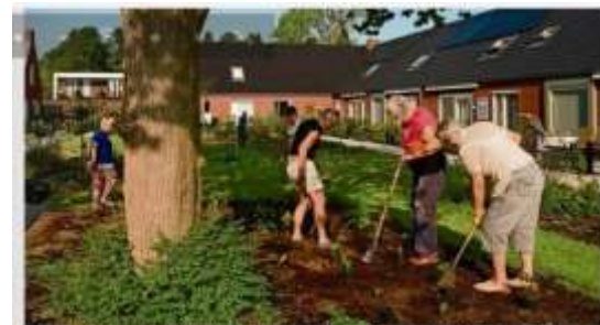
Er is bestaan nieuwe woonvormen waarbij senioren zelfstandig wonen, maar voorzieningen met elkaar delen.

In zowel de plaatselijke media als de landelijke vakpers worden regelmatig aankondigingen van het programma gepubliceerd.